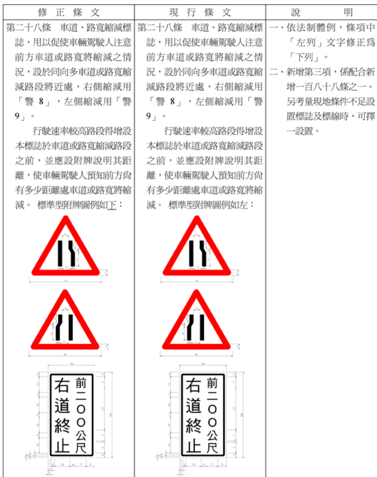
道路交通標誌標線號誌設置規則部分條文修正草案條文對照表